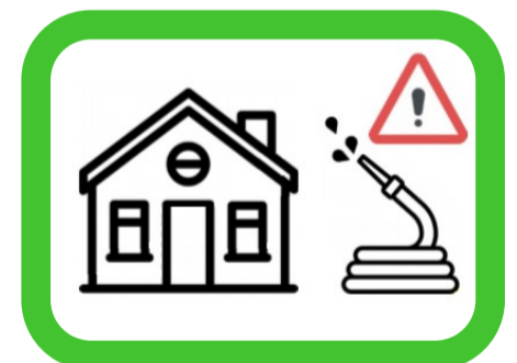
Nettoyage extérieur des bâtiments