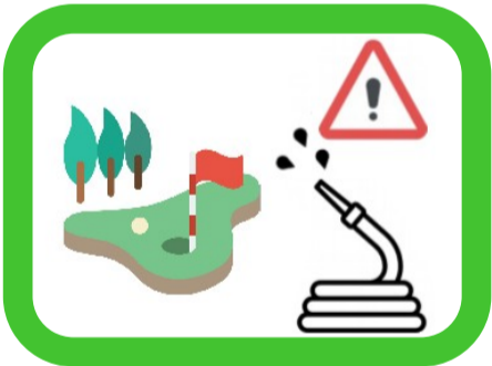
Greens et départs de golf