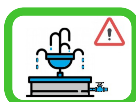
Fontaines publiques sur réseau d'eau potable