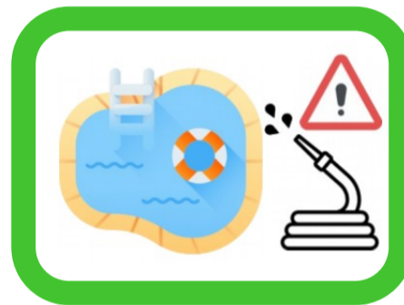
Piscines et plan d'eau