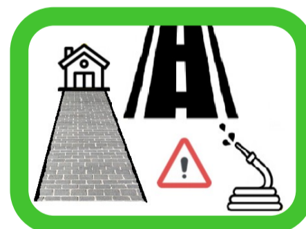
Lavage des voiries, trottoirs ou voies privées