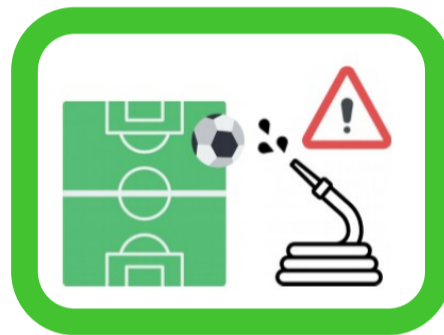
Terrains de sports