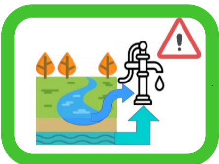
Prélèvements pour irrigation dans cours d'eau (et nappes)