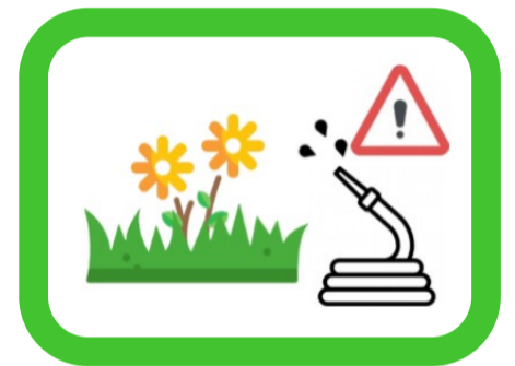
Jardins d'agrément, pelouses, espaces verts publics ou privés et golf